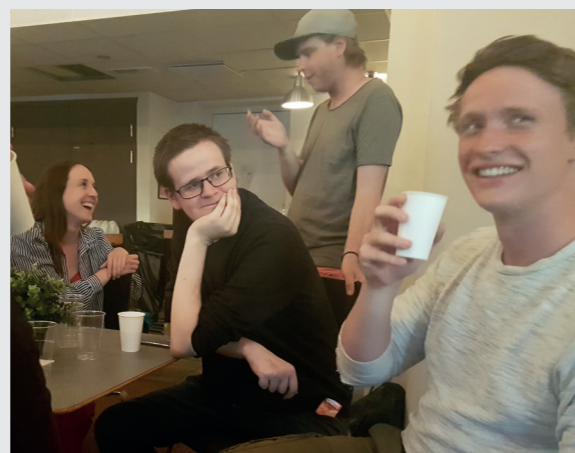
Det ble servert kaffe, og det ble mange gode samtaler rundt bordene.