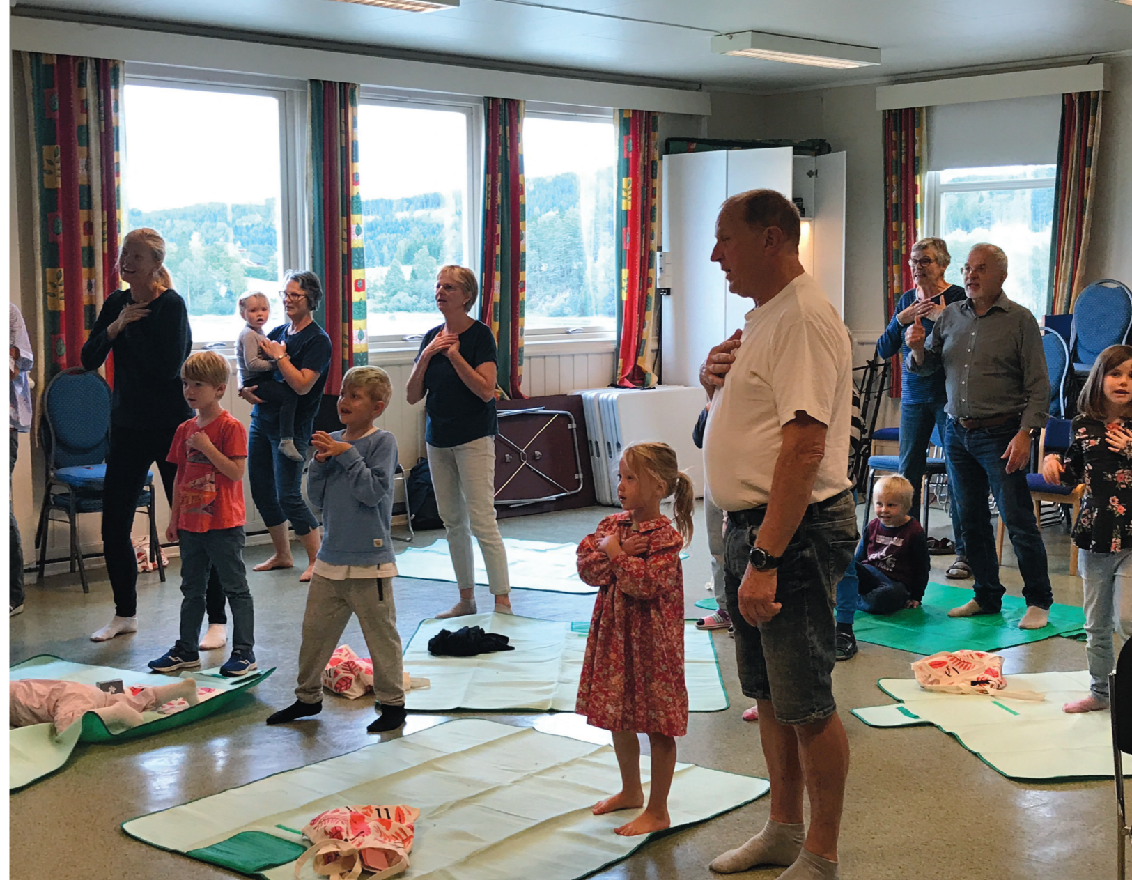
Det er ofte sanger med bevegelser på bibletimene våre. Her fra Besteforeldreleir på Fossheim.