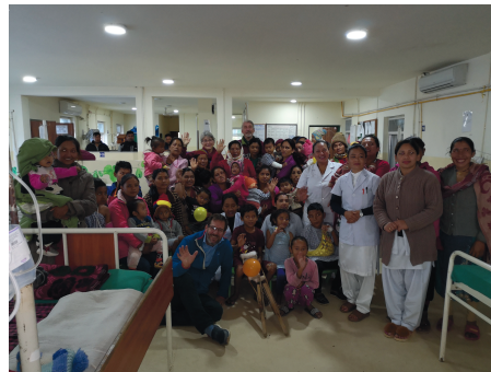
Avskjed med barneavdelingen på sykehuset.

Først så har de lært oss gjestfrihet. Hvor mye det betyr når vi er fremmede å bli tatt inn i deres hjem og familier. Jeg har lært at Gud