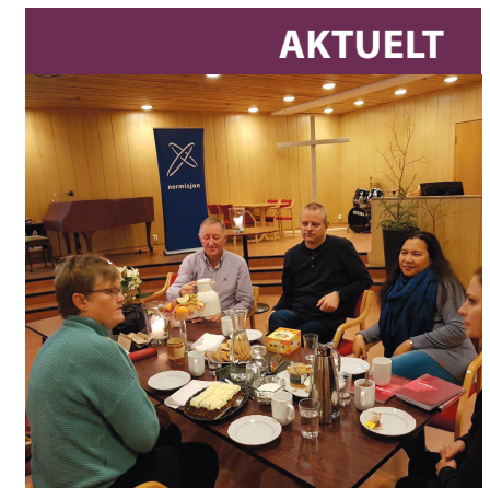
En av kveldene på Lillestrøm med Alphaforeldrekurs.