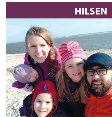
Familien Baghirova i Aserbajdsjan.