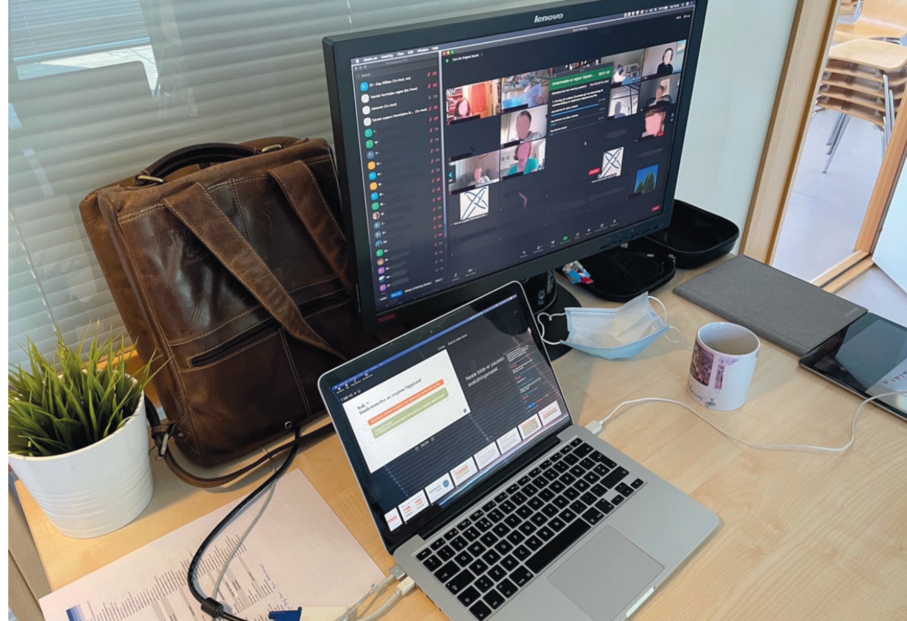
Rigg for digitalt årsmøte.

Oppland har to leirsteder og et ganske aktivt Actaarbeid. De har innhentet mye ekspertise og mener det er økonomisk grunnlag