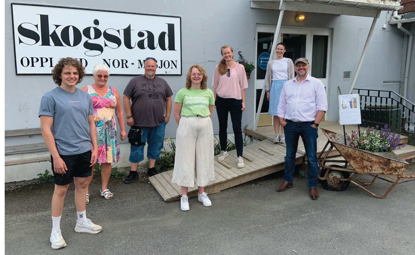
Et godt møte på Skogstad leirsted mellom Normisjon og Acta, Øst og Oppland.

Dette regionbladet er det første bladet som går ut til region Øst, nå inkludert Oppland. Velkommen til